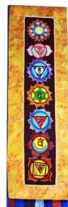
Chakra - Tibetischer Chakra