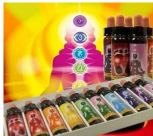
Essenzen (wie Bachblüten)