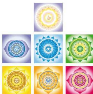
Chakra - Säule Leinwanddrucke als Set Schmuck